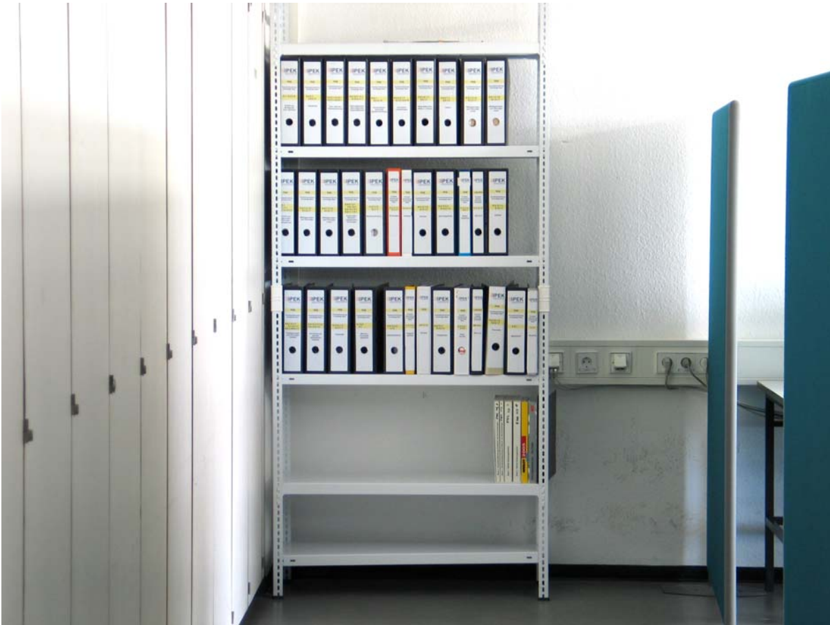
Abbildung 2: Bibliothek als Wissensbasis für die Studierenden