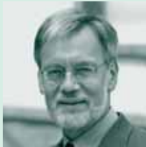
Die Forschungsgruppe Effiziente Algorithmen im Berichtsjahr 2006:

In der folgenden Übersicht über die Forschungsprojekte sind jeweils die Mitarbeiter genannt, die neben dem Leiter der Forschungsgruppe mit wesentlichen Beiträgen an dem jeweiligen Projekt beteiligt sind.