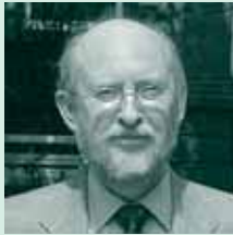
Die Forschungsgruppe Komplexitätsmanagement im Berichtsjahr 2006:

Der zentrale Arbeitsschwerpunkt der Forschungsgruppe Komplexitätsmanagement ist die Untersuchung struktureller Ursachen für das Auftreten von hoher Komplexität und die daraus abgeleitete Entwicklung effizienter algorithmischer Methoden zur Lösung komplexer Probleme. Auf der Basis graphentheoretischer, analytischer und logischer Ansätze sollen Beiträge zum besseren Verständnis komplexer Systeme und komplexer Probleme geleistet werden, um darauf aufbauend eine bessere Unterstützung der Beherrschung solcher Systeme und Probleme durch Werkzeuge der Informatik zu erreichen. Die Anwendungsprojekte erstrecken sich über folgende Themenbereiche: Intelligente Systeme im Finance, Modellierung von Geschäftsprozessen, Entwicklung von Werkzeugen und Methoden für die Programmierausbildung, sowie Kommunikationsstrukturen in Peer-to-Peer-Netzen und deren Anwendungsmöglichkeiten.