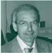
Die Forschungsgruppe Wissensmanagement im Berichtsjahr 2006:

Die Forschungsgruppe beschäftigt sich mit Methoden zur Unterstützung von Wissensmanagement in Unternehmen, mit der Entwicklung von Methoden und Werkzeugen zur Verwirklichung der Idee des Semantic Web sowie mit Fragestellungen im Bereich der Informationswirtschaft und der eOrganisation. Dabei spielen Fragen der Informations- und Applikationsintegration, der automatischen Ableitung von neuem Wissen sowie des intelligenten Zugriffs auf das vorhandene Wissen eine zentrale Rolle. Grundlegende methodische Basis ist die semantische Repräsentation von Wissen durch Ontologien und Metadaten. Intelligente Verfahren der Informationsextraktion und des Daten-, Text- und Web-Minings erlauben die semi-automatische Generierung von Ontologien und Metadaten wie auch die adaptive Anpassung von Anwendungen an das Benutzerverhalten. Die Forschungsgruppe nutzt solche intelligenten und semantischen Methoden, um neue Fragestellungen aus den Bereichen Web Services, Peer-to-Peer-Systeme und Grid-Anwendungen zu beantworten. Die Forschungsgruppe kooperiert eng mit dem Forschungsbereich Information Process Engineering (IPE) am FZI Forschungszentrum Informatik in Karlsruhe sowie dem aus der Gruppe ausgegründeten Unternehmen ontoprise GmbH. Weiterhin bestehen zahlreiche Verbindungen zu europäischen Forschungseinrichtungen und Firmen.