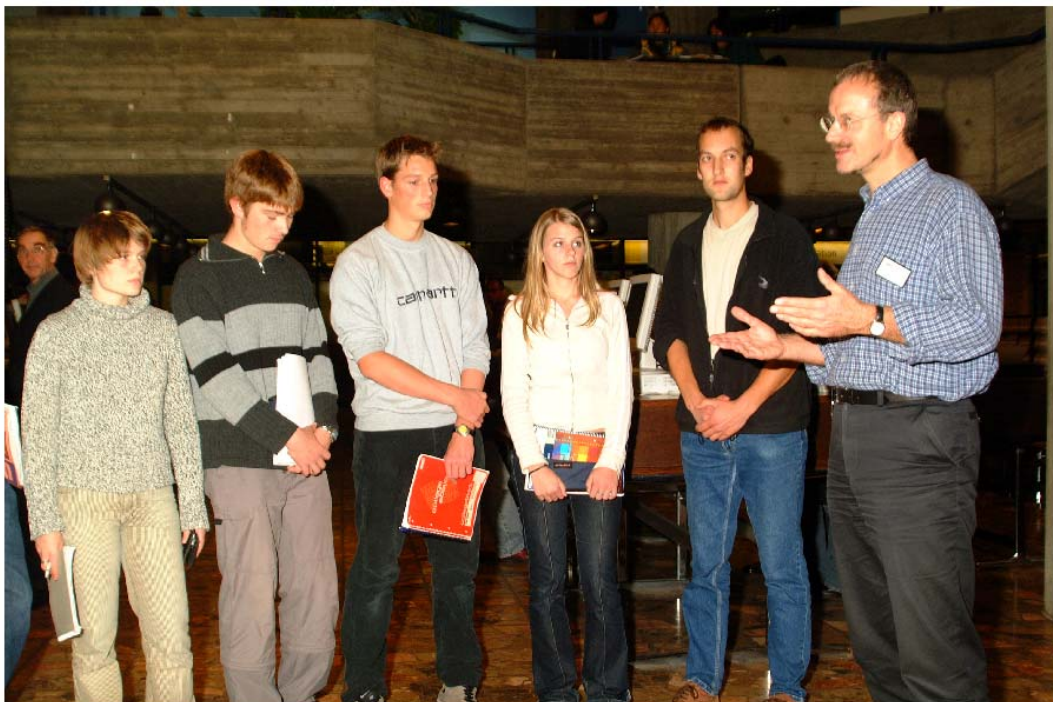
Seminarkurseinführung in der Universitätsbibliothek Freiburg

Das inhaltliche Konzept der etwa 90-minütigen Einführung von Seminarkursen in Grundlagen der Literatur- bzw. Informationssuche und der Beschaffung von Literatur orientiert sich am Prinzip größtmöglicher Anschaulichkeit, Komplexitätsreduktion und Transparenz.