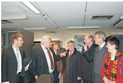
Die Europaabgeordneten zu Gast an der Uni.

Nachdruck mit freundlicher Genehmigung von www.ka-news.de. Der Text wurde geringfügig verändert.