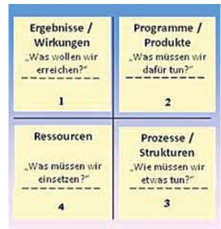
Abbildung 2: Fragenkreislauf

Grafisch dargestellt stellt sich der Kreislauf dieser Fragen wie folgt dar: