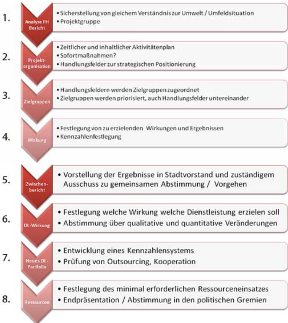
Abbildung 3: 8-Stufen-Vorgehensmodell

Für ein großstädtisches System ergeben sich unterschiedliche Handlungsfelder für die Zentralbibliothek und die Stadtteilbibliotheken: Das Handlungsfeld Kulturarbeit wird in Köln primär durch die Zentrale abgedeckt, während die integrative und soziale Arbeit ihren Schwerpunkt eher in den Außenstellen haben. Eine Schnittmenge ergibt sich beim Handlungsfeld Bildung, das folgendermaßen aufgestellt ist: