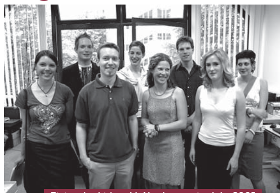
Einige der bisher 14 Absolventen im Jahr 2005

Im Sommersemester 2005 zeigte das ZAK Fotografien von Bernd Seeland, die in ihrer schlichten Sachlichkeit und ihrer Menschenleere an die Fotografien