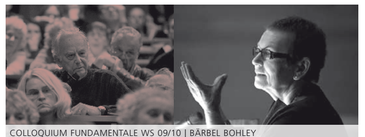
COLLOQUIUM FUNDAMENTALE WS 09/10 | BÄRBEL BOHLEY

Alle Vorträge der Reihe sind abrufbar auf der Homepage http://www.zak.kit.edu/212.php .