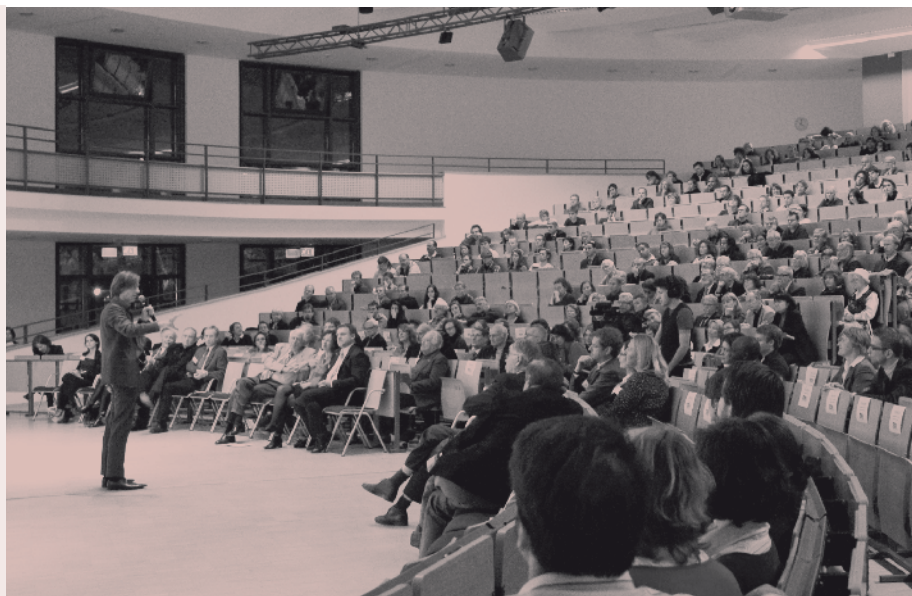
JUBILÄUMSFEIER 60 JAHRE STUDIUM GENERALE | FESTREDE VON DR. RICHARD DAVID PRECHT