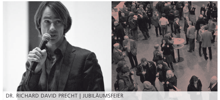
DR. RICHARD DAVID PRECHT | JUBILÄUMSFEIER

Der Festredner des Abends war der bekannte Philosoph und Schriftsteller Dr. Richard David Precht, Autor des Werks »Wer bin ich – und wenn ja, wie viele?«. In seiner Rede mit dem Titel »Die Einheit des Wissens« stellte er dar, dass die strenge Trennung von Geistes- und Naturwissenschaften ein historisch gewachsenes Konstrukt sei, das neben der nicht zu leugnenden Effizienzsteigerung auch einen ganz erheblichen Verlust mit sich gebracht habe: Grundlegende gegenwartsbezogene Fragestellungen enthielten per se Anteile beider Disziplinen und könnten demnach nicht ohne eine frühzeitige interdisziplinäre Zusammenarbeit vorangetrieben werden. Die Einmischung der Geisteswissenschaften in aktuelle gesellschaftspolitische Fragen sieht er heute als „wichtiger denn je“ an.