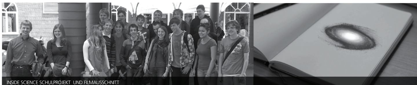
INSIDE SCIENCE SCHULPROJEKT UND FILMAUSSCHNITT

Am Samstag, 3. Dezember 2011, um 20.30 Uhr zeigt InsideScience die am KIT produzierten Wissenschafts- sowie die Schulprojekt-Filme. Zur Tagung sind Studierende, Doktorandinnen und Doktoranden sowie alle Interessierten herzlich eingeladen. Ein ausführliches Programm und weitere Informationen rund um InsideScience gibt es unter www.kit.edu/inside-science .