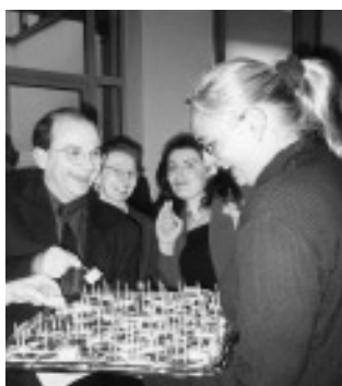
Stimmung beim Empfang

hin? Risiken und Chancen für eine Multimediageneration“. Er betonte die Erleichterung des Zugangs zum Wissen durch die Neuen Medien, und zugleich die Problemen, die bei der Bewertung der einzelnen Quellen entstehen.