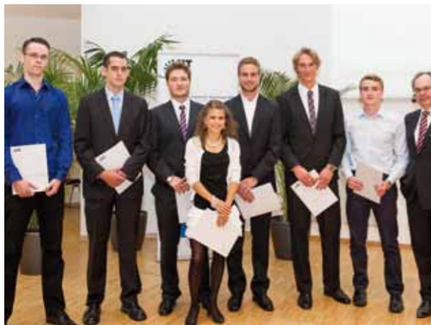
Gruppenbilder der Bachelor-Überreichung und viele weitere Bilder finden Sie in der Bildergalerie auf unserer Homepage: http://www2.mach.uni-karlsruhe.de/Kolloquium/koll0712.php