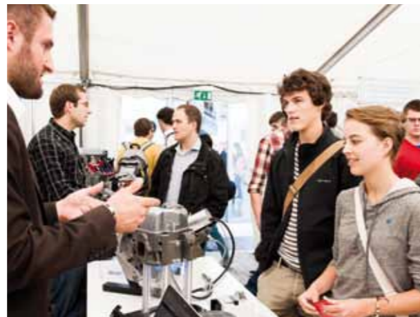
Studierende im Gespräch mit der Standbesetzung auf der Institutsmesse. Unser Foto zeigt den Stand des Instituts für Kolbenmaschinen.

ellen späteren Berufsfelder zu verschaffen. Gleichmaßen bei Studierenden und Industriepartnern kam der Maschinenbautag besonders gut an, da er sich konzeptionell dahingehend wesentlich von vielen Recruiting-Messen unterscheidet, bei denen Standpersonal oftmals aus den Personalabteilungen, seltener aus den Fachabteilungen, besteht. Beim KIT-Maschinenbautag haben Industrievertreter die Möglichkeit, zu einem frühen Zeitpunkt mit den angehenden Ingenieuren in Kontakt zu treten und sich gegenseitig zu „beschnuppern“.