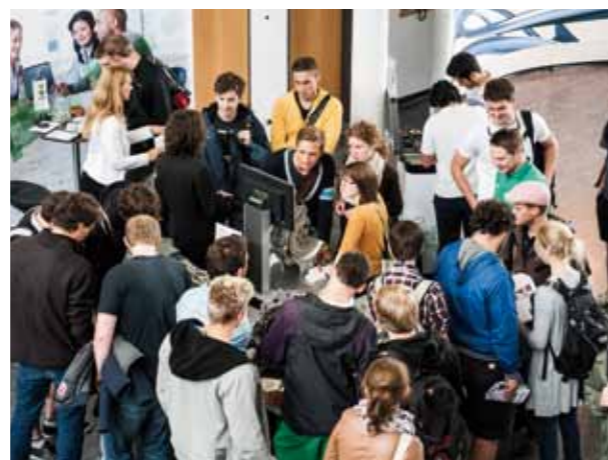
Maschinenbau hautnah: Die Institutsmesse des Maschinenbautags mit vielen Exponaten zum Anfassen fand bei den Studierenden großen Anklang.