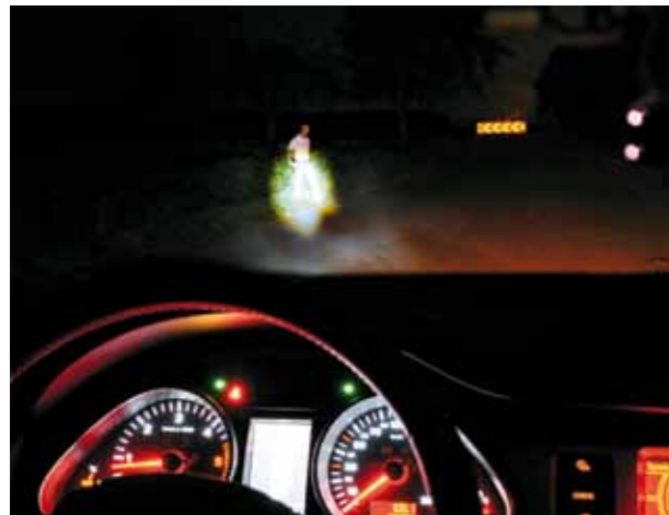
Eine potentielle Gefahrenstelle im Verkehrsbereich wird durch das intelligente Lichtsystem besonders beleuchtet und ist somit für den Fahrzeughführer früher erkennbar.