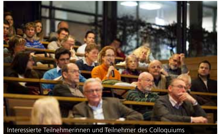
Interessierte Teilnehmerinnen und Teilnehmer des Colloquiums