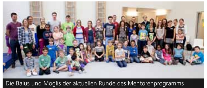
Die Balus und Moglis der aktuellen Runde des Mentorenprogramms

Namensgeber für das bundesweite Programm ist der Kinderbuchklassiker „Das Dschungelbuch“. Die freundschaftliche Beziehung zwischen dem Bären Balu und dem Jungen Mogli, der Orientierung, Aufmerksamkeit und Geborgenheit braucht, bildet das Modell für die am Mentorenprogramm Teilnehmenden. Junge Erwachsene begleiten als Patinnen und Paten ein Jahr lang je ein Kind im Grundschulalter. Durch persönliche Zuwendung und aktive Freizeitgestaltung helfen sie den Kindern, sich in unserer Gesellschaft zu entwickeln und die Herausforderungen des Alltags besser zu meistern. Balu und Mogli treffen sich einmal in der Woche für ein paar Stunden, in denen sie durch Gespräche, Spiele, sportliche oder kulturelle Aktivitäten gemeinsam ihren Horizont erweitern. Die Studierenden qualifizieren sich für ihre Rolle als Balu fortlaufend in einem wöchentlichen Begleitseminar und werden von einer erfahrenen Seminarleiterin betreut. Die Erlebnisse mit ihrem Mogli reflektieren sie in einem Online-Tagebuch. Die positiven Effekte des Programms werden durch die Wirksamkeitsforschung bestätigt. Eine Studie zum Social