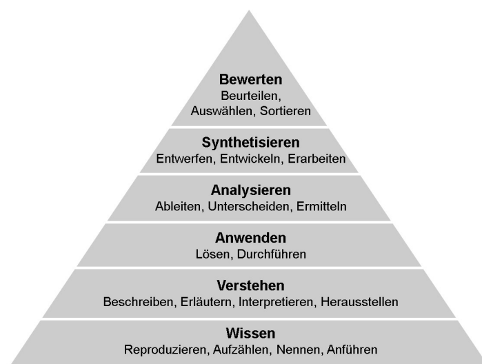
Abb. 2: Taxonomie kognitiver Lernziele nach Bloom (1973)

Für die Definition der Lernziele wird im Dossier Unididaktik der Universität Zürich (2010a) zum Thema Taxonomie Matrix folgende Vorgehensweise vorgeschlagen: Zunächst werden die Lernziele formuliert und anschließend die Lernaktivitäten der Studierenden festgelegt. Danach erfolgt die Planung der Leistungsüberprüfung. Die definierten Lernziele werden schließlich anhand ihrer Schwierigkeit und Komplexität sortiert. Hierzu hat Bloom (1973) eine Lernzieltaxonomie entwickelt, mit der die kognitiven Ziele in fünf verschiedene Lernstufen eingeordnet werden können: