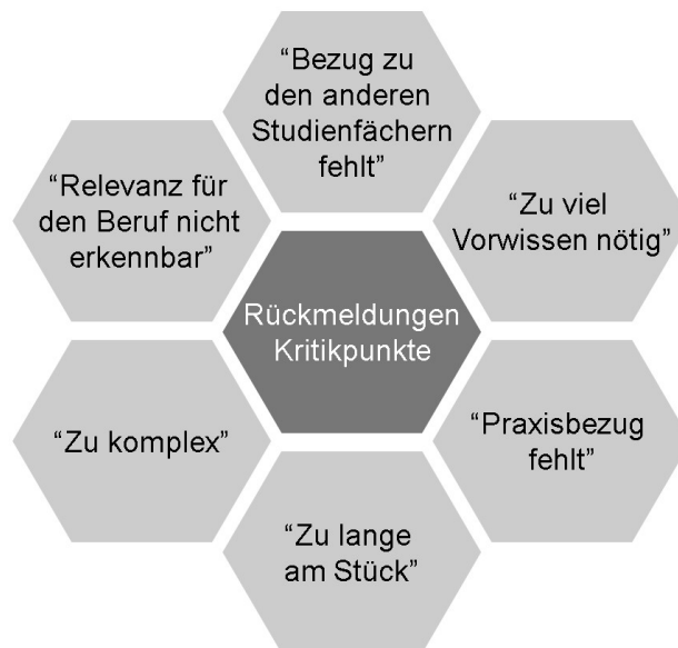
Abb. 1: Wesentliche Kritikpunkte aus Sicht der Studierenden im ersten Semester

Über den Verlauf des ersten Semesters hinweg holte ich kontinuierlich Rückmeldungen der Studierenden in Form von einfachen Studierendenbefragungen ein. In der folgenden Abbildung sind die aus meiner Sicht wesentlichen Kritikpunkte der Studierenden im ersten Semester dargestellt.