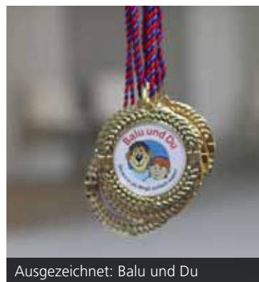
Ausgezeichnet: Balu und Du

Zahlreiche Karlsruher Einrichtungen unterstützen die außerschulischen Aktivitäten der „Balus“ und „Moglis“. So dürfen die Gespanne in ihrer gemeinsamen Zeit kostenfrei in das Naturkundemuseum, das ZKM und den Zoologischen Stadtgarten. Das Europabad gewährt einen freien Eintritt während des Jahres der Patenschaft. Für das Jahr 2015 erhielt das Programm Spenden vom Lions Club Karlsruhe-Zirkel e.V. und von der KIT-Stiftung. Im Sommersemester startet die neue Runde. Am Donnerstag, 5. Mai 2016 findet ein Fest zum Kennenlernen im Zirkus Maccaroni in Karlsruhe statt, bei welchem alle „Balus“ und „Moglis“ des neuen Jahrgangs mit ihrer neuen Partnerschaft beginnen. Wissenswertes zum Programm gibt es unter: www.zak.kit.edu/balu_und_du .