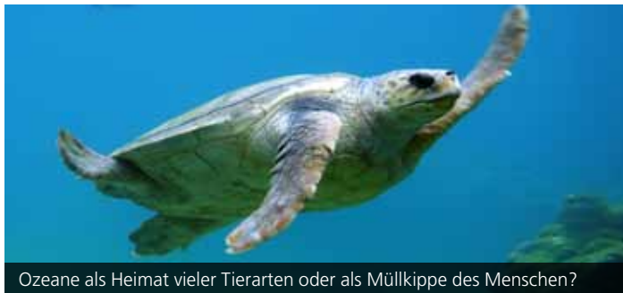
Ozeane als Heimat vieler Tierarten oder als Müllkippe des Menschen?