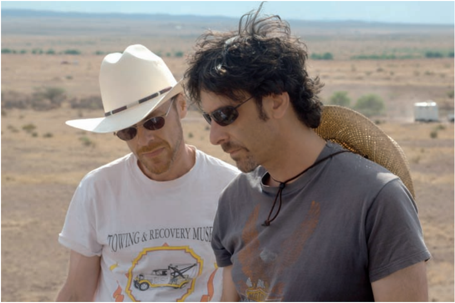
Die Brüder Ethan (links) und Joel Coen

„No Country for Old Men“ (2007) von Joel und Ethan Coen kann ohne weiteres als düsterer Crime- und Action-Thriller klassifiziert werden. Doch ist der Westernbezug geradezu zwingend, nicht nur durch den Handlungsort Südtexas, sondern auch durch Handlungsaufbau und thematische Elemente, die ausdrücklich auf den historischen Westen Bezug nehmen. Am deutlichsten wird das in der Person des Sheriffs, der, explizit oder im Traum, seine Situation mit derjenigen früherer Generationen vergleicht, besonders mit seinem Vater, der ihm im Amt voranging. Dabei wird auch die grundsätzliche Frage aufgeworfen, ob denn Zivilisierung wirklich ein unumkehrbarer Vorgang sei, wie es in vielen klassischen Western behauptet wird, oder nicht eher ein dynamischer Prozess. Soziale Normen, nach Max Weber (1922), bleiben ja nur so lange in Geltung, wie sie durchgesetzt werden. Schon immer war der Western Schauplatz von Normkonflikten; der Frontier-Code, das Normensystem der Nichtsesshaften, dem die Filmhelden der späteren Western von John Ford folgten, war nicht immer vereinbar mit dem der entstehenden bürgerlichen Gesellschaft.