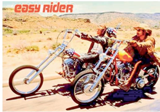
„Easy Rider“ mit Peter Fonda (links) und Dennis Hopper

Cage, 0:11:08) stellte klar: “The movie was like a Western for me.” Und im Audiokommentar zu Easy Rider (DVD 1999, 0:09:49) präzierte er: “A classic kind of Western – two lone guys, two gunfighters, two outlaws... Billy the Kid and Wyatt Earp.”