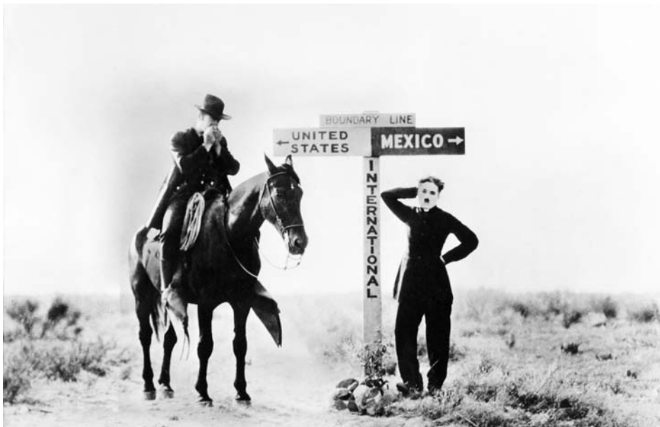
Charles Chaplin: „The Pilgrim“

Im 19. Jahrhundert konnte man sich noch schlicht fragen: Wo auf der Welt kann ich einen Ort finden, wo ich frei und in Selbstbestimmung leben kann? Heute fragen wir uns: Kann es im „globalen Dorf“, in einer Welt, die unbeschränkte Mobilität, dauerhafte Beschleunigung und ständige Erreichbarkeit zur Lebens- und Geschäftsgrundlage erhebt, überhaupt noch einen Ort geben, an dem wir frei und unter Gleichen leben können, und den wir, ohne Illusion und Selbstbetrug, Heimat nennen können? Die Postmoderne geht, wenigstens zu einem guten Teil, den Weg der Aufklärung konsequent weiter (und realisiert dadurch einen zentralen Grundwert der Moderne), indem sie die Dogmatik und die real existierenden Folgen der Modernisierungsprozesse hinterfragt und dogmatische Erstarrung zu vermeiden