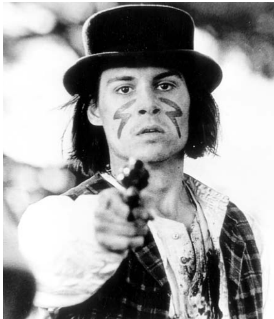
„Dead Man“ mit Johnny Depp

In der präzise durchkomponierten Einleitungssequenz wird die lange Bahnreise in den Westen zur Erfüllung des amerikanischen Traums als fortgesetzte Traumatisierung gezeigt: während die Reisenden auf dem Weg von Ost nach West verschiedene Ausprägungen zivilisatorischer Erscheinungsformen repräsentieren – nacheinander Bürger, Bauern, Pioniere, Jäger, wird draußen die Landschaft immer karger. Der Westen erscheint als Friedhof der Geschichte: zerfetzte Planwagen, zerstörte Indianerzelte, massenhaft abgeschlachtete Büffel säumen die Bahnleise. Ziel dieser Reise ist eine Stadt namens „Ma-