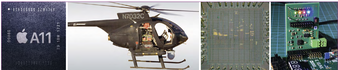
Abb.2: Diese Entwicklungen zeigen beispielhaft, dass die neuen Ansätze in der Forschung, in Prototypen und in Produkten angewendet werden. (V.l.n.r.):

[1] Apples A11-Chip mit Secure Element, in dem der L4 Betriebssystemkern verwendet wird; [2] Unbemannter Boeing Hubschrauber kontrolliert durch das offene, bewiesene sel4; [3] Sicherheitsmodul mit dem offenen LEON-