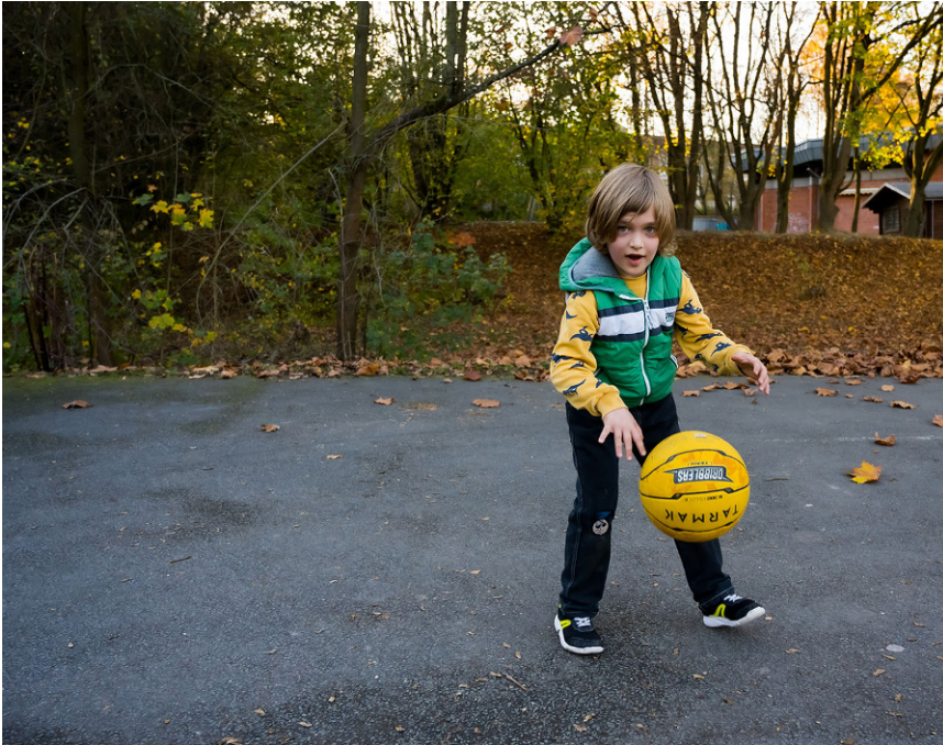
Abb. 2 ▲ Kinder und Jugendliche waren im Lockdown gezwungen, sich intensiv mit sich selbst zu beschäftigen.

zwei bis drei Stunden digitalen Unterricht. Dann erledigt sie ihre Hausaufgaben. Und dann ist ihr langweilig. Ihre Freundinnen darf sie nicht sehen, sie schreiben sich, aber wissen auch schon lange nicht mehr worüber, unter anderem da sie ja die Jungs aus der Klasse auch nicht mehr sehen. Ihre Eltern haben ihr ein kleines Trampolin für den Garten gekauft, das hat kurz Spaß gemacht, aber jetzt möchte sie es auch gern ihren Freundinnen zeigen. Die Großeltern haben es schon gesehen, im Garten treffen sie sich ab und zu mit Abstand. Die Oma backt viel Kuchen und näht Masken, die sie vorbeibringt, aber sie dürfen den Kuchen nicht gemeinsam essen. Mit ihrem Vater zusammen kocht sie oft das Mittagessen, manchmal geht sie auch allein dafür in den Supermarkt. Man soll ja nicht mit der ganzen Familie einkaufen gehen. Abends gibt es oft Diskussionen darüber, was im Fernsehen geschaut wird, normalerweise gibt es diese nicht, da die Familie selten komplett zu Hause ist und im Verein, mit Freund*innen oder bei Verwandten in der Umgebung unterwegs ist.