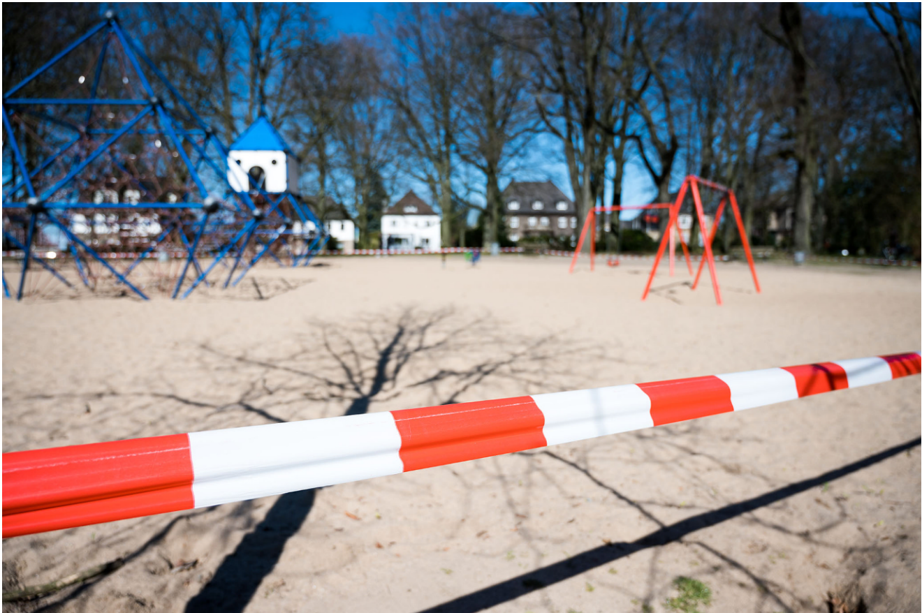
Abb. 1 ▲ Eine negative Seite des Lockdowns: Der Spielplatz ist gesperrt.

Und dann kam Corona, die Krankheit, das Virus, der leichte, aber wochenlange Lockdown in Deutschland.