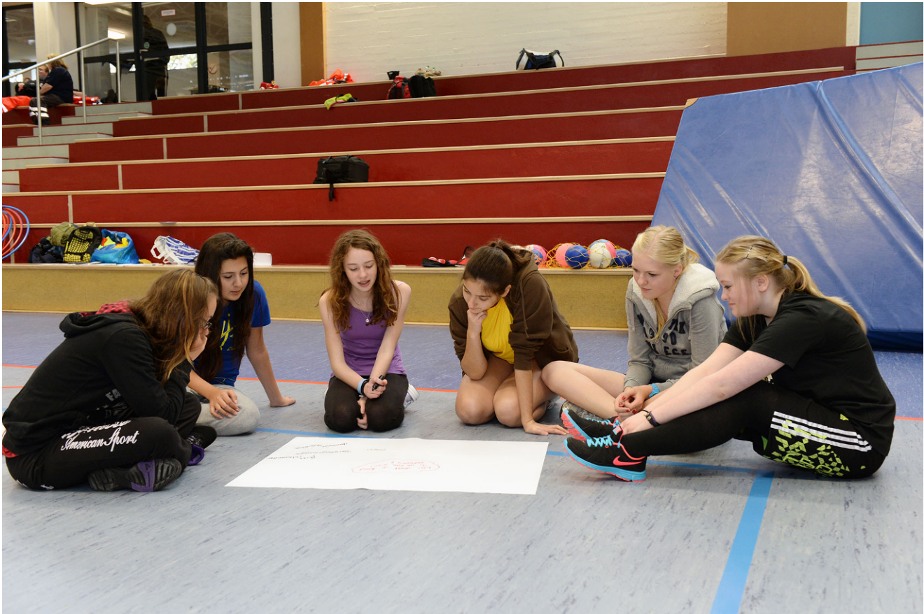
Abb. 3 ▲ Der Sportraum in Gemeinschaften wie Sportvereinen lehrt Kinder und Jugendliche das soziale Miteinander auf spielerische Art und Weise.

für das Ehrenamt, bauen Calisthenics-Parks in ihre Sportanlagen und schaffen Sport- und Bewegungsangebote, die mit der Zeit gehen. Dennoch sollte nicht das gesamte Konzept des Sportvereins über den Haufen geworfen werden. Es kann ja sein, dass das Konzept eines verbindlichen wöchentlichen Trainings mit der gleichen Peergroup und dem*der gleichen Trainer*in das Beste ist, was den Kindern und Jugendlichen in dieser Situation passieren kann.