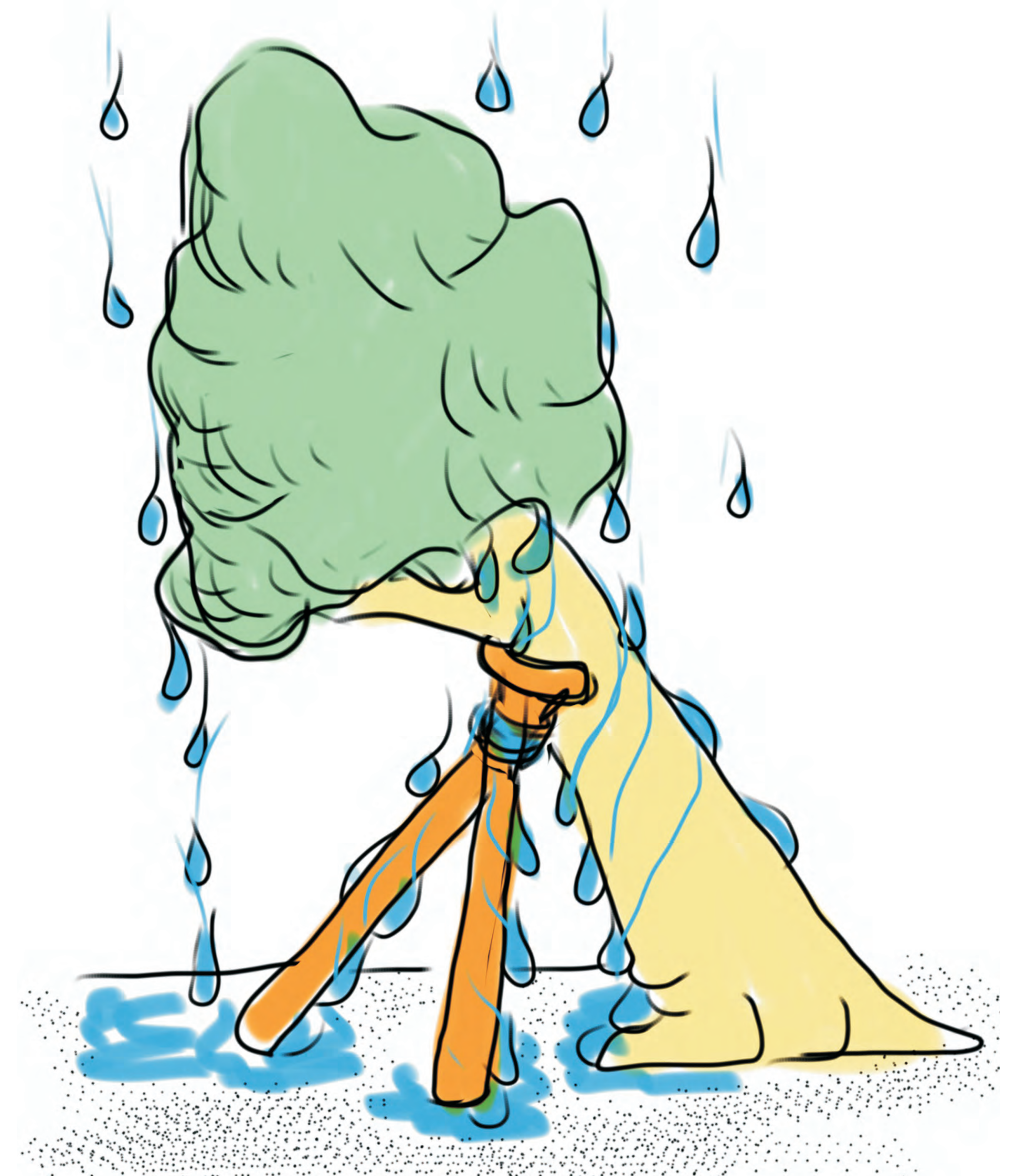
Rinwasser an Stützen

Die Zugwurzel schiefer Bäume sollte nicht in durch Rinwasser aufgeweichter Erde ankern. Die Holzpfosten einer Baumstütze sollten nicht durch Gerinne dauerfeucht gehalten werden.