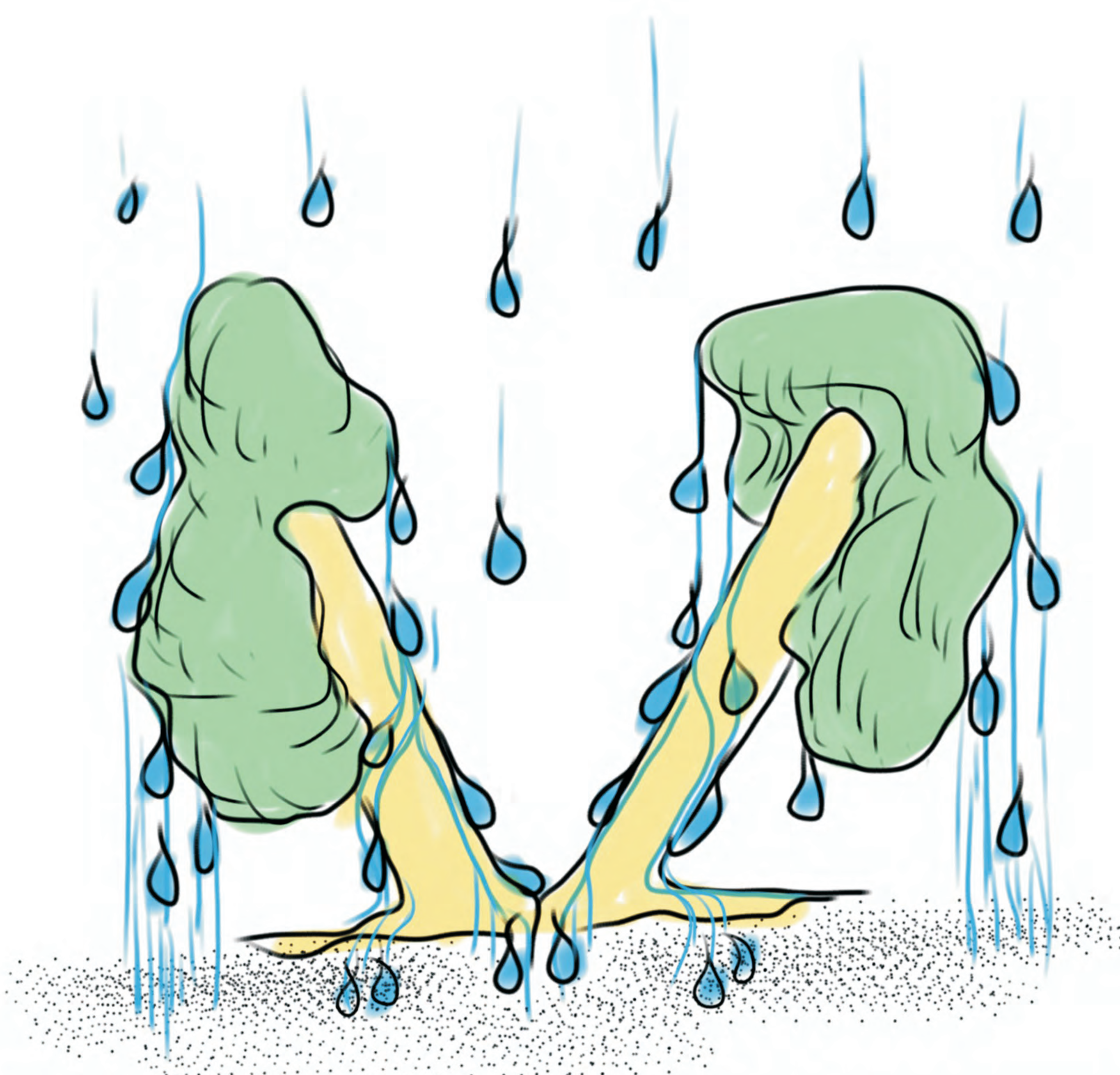
Bündelbäume: Traufenwasseraussendienst mit Rinwasserzentrale!

Die Hydraulik schiefer Bäume schont oft die Zugwurzelbettung!