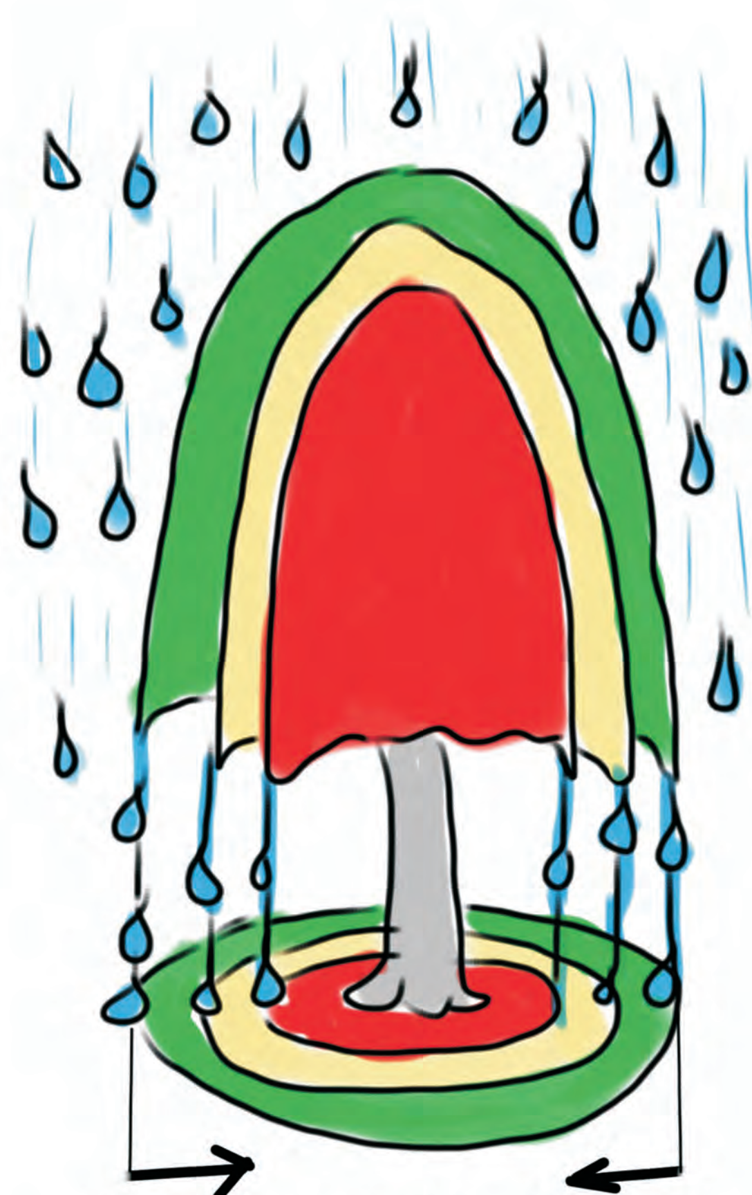
Einwärtswandern der Traufe

Das Regenwasser scheidet sich in peripheres Traufwasser und Rinnwasser. Ast- und Zweigabsenkungen verändern den Traufradius.