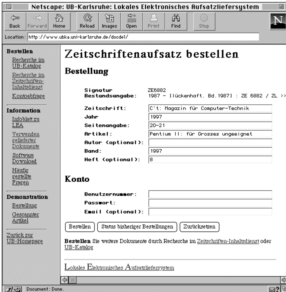
Abbildung 1: LEA-Bestellmaske mit Datenübernahme aus dem Zeitschrifteninhaltsdienst (ZID).

Stammt die Recherche hingegen aus dem OPAC, müssen noch die Daten zu dem gewünschten Aufsatz manuell ergänzt werden. Hierbei sind insbesondere Angaben zu Titel und Erscheinungsjahr des Artikels sowie die Seitenangaben auszufüllen. Als weitere optionale Felder gelten Autor-, Band- und Heftangaben. Diese erleichtern bei Falschangaben des Bestellers die Aufsatzsuche. Mit der Authentifizierung über Bibliotheksbenutzernummer und Paßwort besteht die Möglichkeit, über die eigentliche Bestellung hinaus eine Email-Adresse anzugeben. Über die Adresse erhält der Benutzer dann automatisch Benachrichtigungen und Informationen zum Ergebnis seiner Bestellung. Alternativ gibt es eine Kontoabfragefunktion.